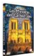
Les mystères des Cathédrales