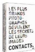
Les plus grands photographes