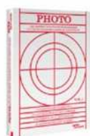
Les grands courants Photographiques