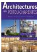
architectures du Poitou-Charentes