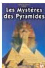
Les mystères des Pyramides